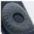
Orla aberta do anel de silicone para a rótula

Variante desportiva E+motion, v. pág. 115