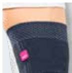
Banda de silicone para fixação adicional

Variante desportiva E+motion, v. pág. 114