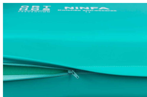
Lábio protetor do fecho