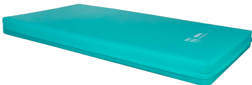
Capa bielástica maleável

Colchão amigo do ambiente fabricado com espumas ecológicas (soja), diminuindo significativamente a quantidade de petróleo usado no seu fabrico